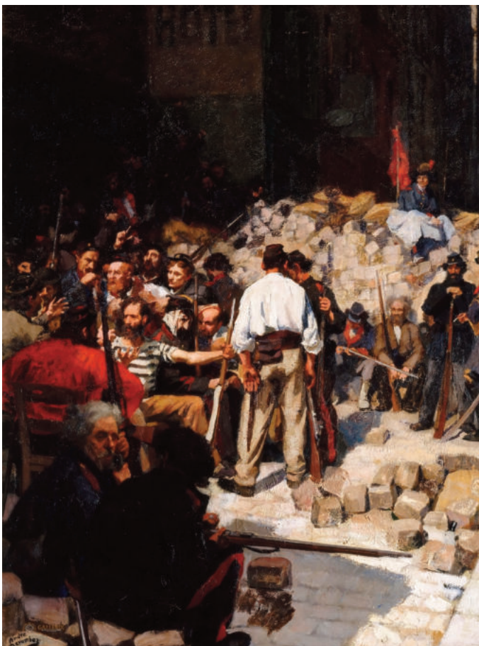
Die Barrikade, Gemälde von André Devambez um 1911.

Der Charakter der Kommune als proletarischer Diktatur und ihre tiefe Volksverbundenheit, drückten sich in der Einheit von Wort und Tat der Kommunarden aus: "Wie in der Kommune fast nur Arbeiter oder anerkannte Arbeitervertreter saßen, so trugen auch ihre Beschlüsse einen entschiedenen proletarischen Charakter. Entweder dekree-