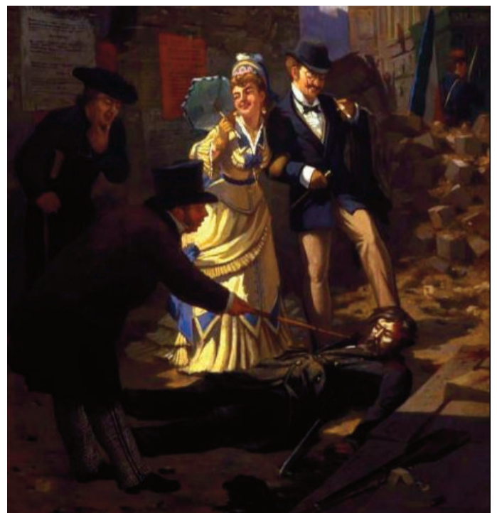
Die Bourgeoisie kehrt nach der Niederschlagung der Kommune nach Paris zurück.

Der Staat war im Sozialismus notwendig zur Gewährleistung äußerer und innerer Sicherheit und als "operativer Verwalter des Volkseigentums, der die Bedingungen für ein rasches Produktivitätswachstum schafft", um die materiellen Existenzbedingungen der sozialistischen Gesellschaft weiter auszubauen, "allgemeine Interessen durchzusetzen und einen demokratischen Prozeß der Interessenabstimmung" politisch und rechtlich zu gewährleisten. (Ekkehard Lieberam, Wendige Vergesslichkeit) Das Ziel einer "Selbstregierung der Produzenten" wurde nicht aufgegeben, verlangt aber ein funktionierendes Gesamtsystem gegenseitiger Kontrollen und der Kontrolle von unten, das sich nicht herausbildete. Bis "ein in neuen, freien Gesellschaftszuständen herangewachsenes Geschlecht imstande sein wird, den ganzen Staatsplunder von sich abzutun". (Engels)